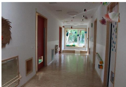
Fahrzeug fahren, Ballspiel, Klettern