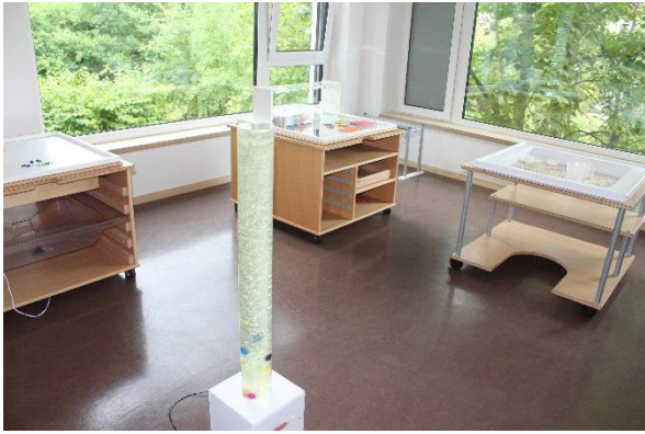
Forschen mit unterschiedlichen Materialien