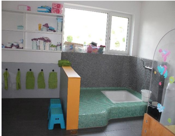
Wickelbereich, Toilette, Wasserspielbereich